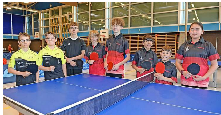
Trois jeunes du CTT Estavayer et 5 du CTT Domdidier étaient en lice.